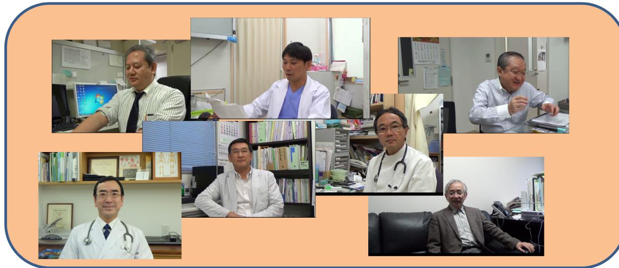
強化型在宅支援診療所